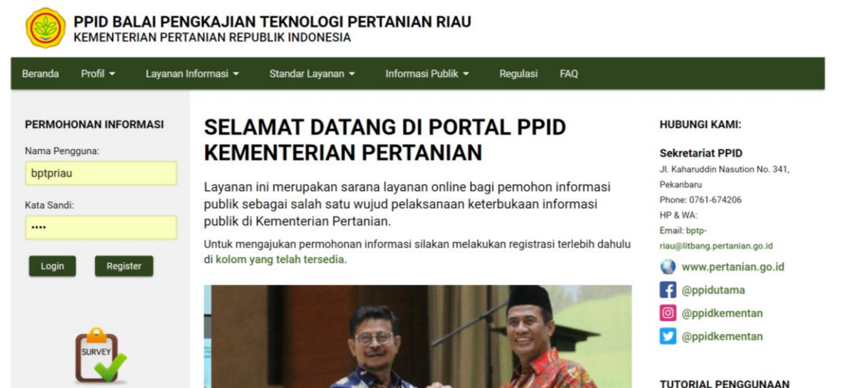
Gambar 4. Portal PPID BPTP Riau

Informasi publik BPTP Riau juga bisa diakses melalui portal PPID dengan alamat http://btpriau.ppid.pertanian.go.id/ . Beberapa informasi yang diupload adalah rencana kerja, laporan keuangan, laporan tahunan, LAKIN, Daftar Informasi Publik, Aset, SOP, dll. Selain itu juga informasi teknologi yang dihasilkan oleh BPTP Riau dapat diakses melalui website dan media sosial (facebook, instagram, dan twitter). Sedangkan permohonan online melalui portal PPID tidak ada.