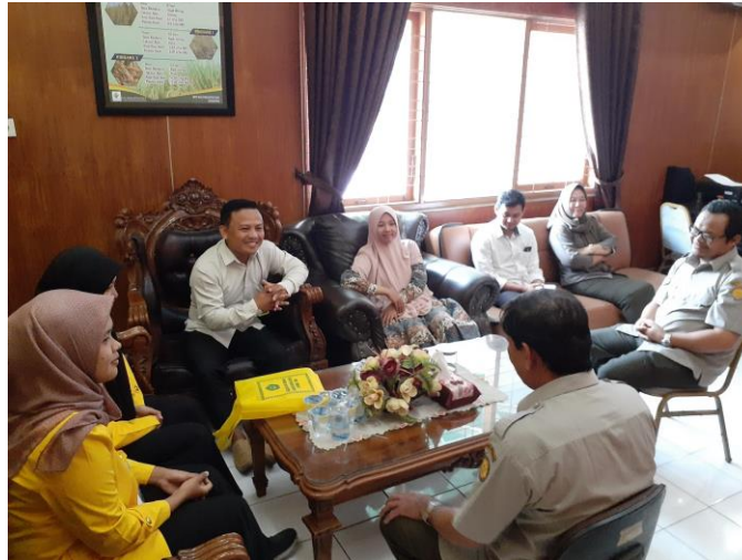
Gambar 3. Penjab PPID menerima kunjungan masyarakat

Informasi publik BPTP Riau juga bisa diakses melalui portal PPID dengan alamat http://btpriau.ppid.pertanian.go.id/ . Beberapa informasi yang diupload adalah rencana kerja, laporan keuangan, laporan tahunan, LAKIN, Daftar Informasi Publik, Aset, SOP, dll. Selain itu juga informasi teknologi yang dihasilkan oleh BPTP Riau dapat diakses melalui website dan media sosial (facebook, instagram, dan twitter). Sedangkan permohonan online melalui portal PPID tidak ada.